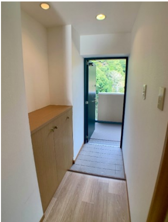
■玄関ホール、シューズクローゼット