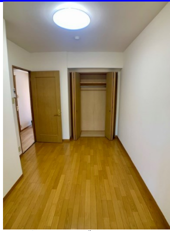
■洋室 クローゼット側