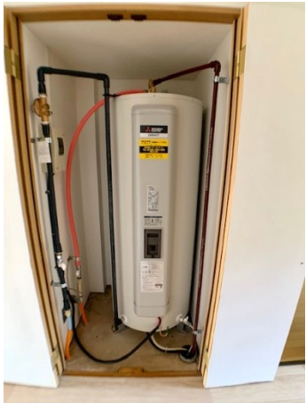
■室内電気温水器 (2018年12月)