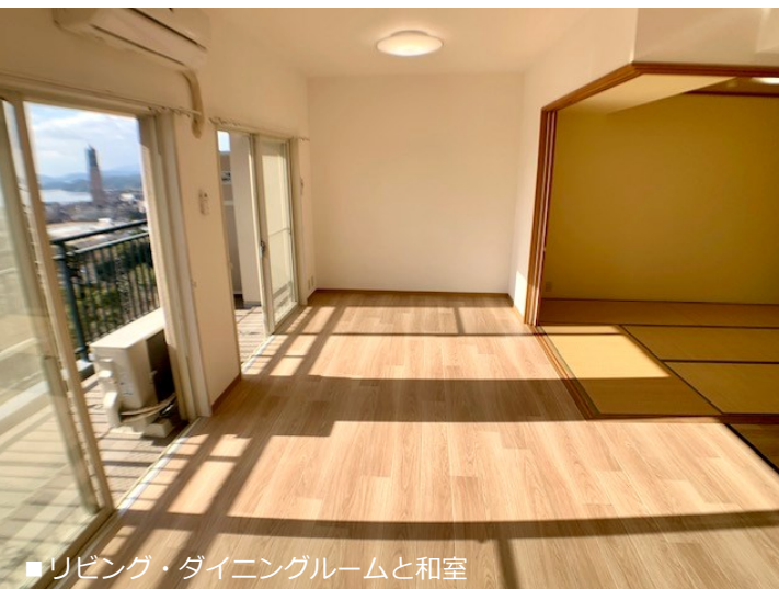
■ リビング・ダイニングルームと和室

リビング・バルコニーからの眺望。朝・昼・夜夫々に美しい眺め♪ ハウステンボスの街並みと、遠くには美しい大村湾が望めます。