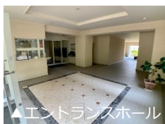
▲ エントランスホール