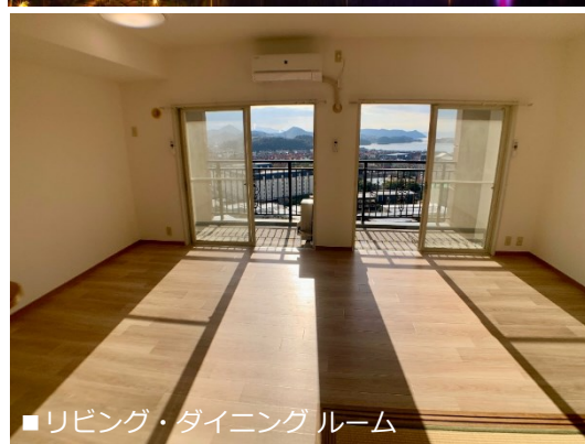
■ リビング・ダイニングルーム

リビング・バルコニーからの眺望。朝・昼・夜夫々に美しい眺め♪ ハウステンボスの街並みと、遠くには美しい大村湾が望めます。