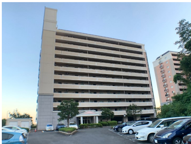
ヒルズⅢ 西側（エントランス側）