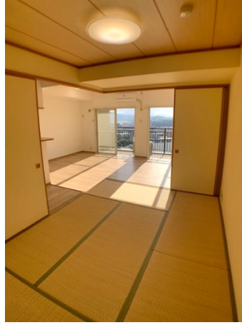
■和室からリビング方面