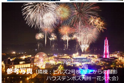
参考写真 (隣棟：ヒルズ2号棟 屋上からの撮影 ハウステンボス九州一花火大会)