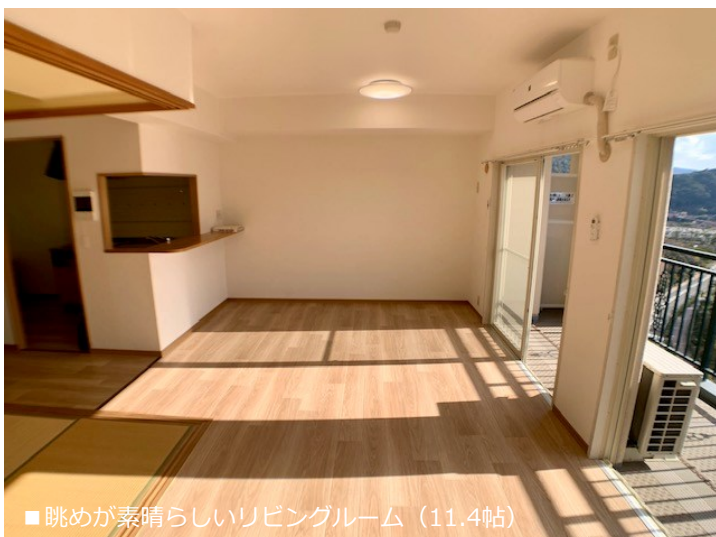
■ 眺めが素晴らしいリビングルーム (11.4帖)

HUIS TEN BOSCH HILLS ・ 写真の照明器具・エアコン・カーテンレールは付帯。