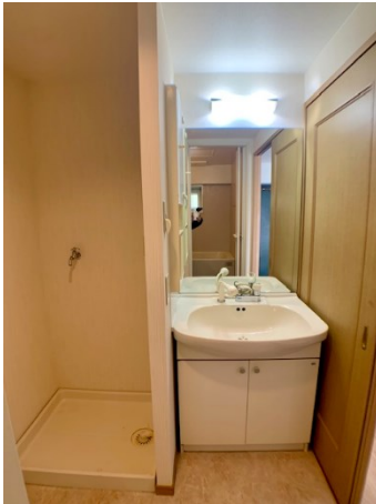
■洗濯機置場・洗面台