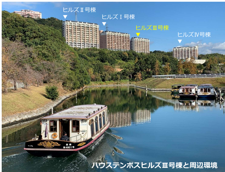
ハウステンボスヒルズⅢ号棟と周辺環境