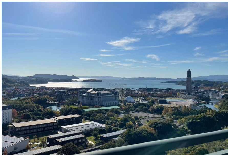
バルコニーからはハウステンボスの街全体と遠くに大村湾までの景色を見渡せます