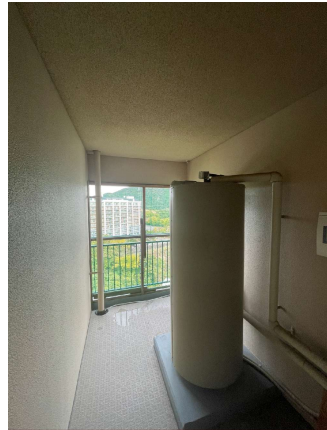
和室に面したバルコニー