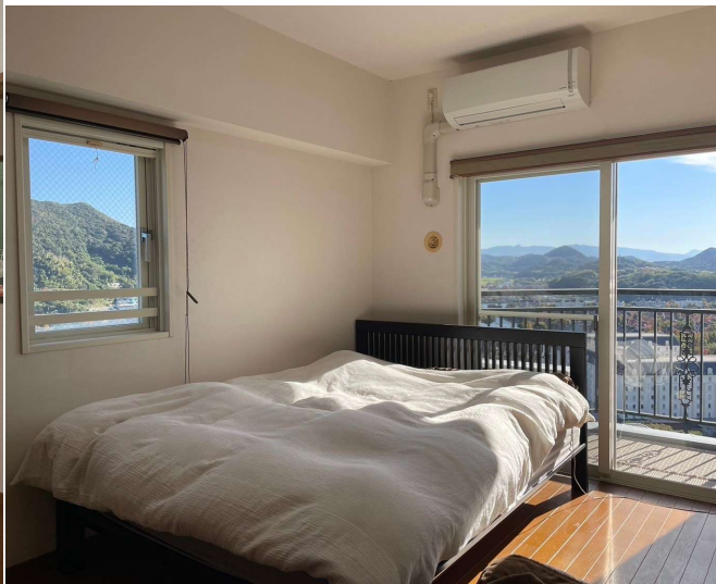
開口部が多く明るく風通しのよい角室。(左)リビングダイニング、(右)リビング隣接の7帖洋室