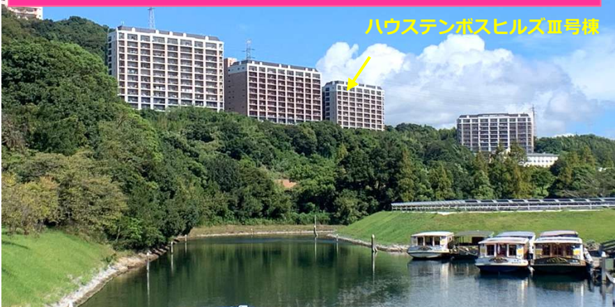
ハウステンボスヒルズIII号棟