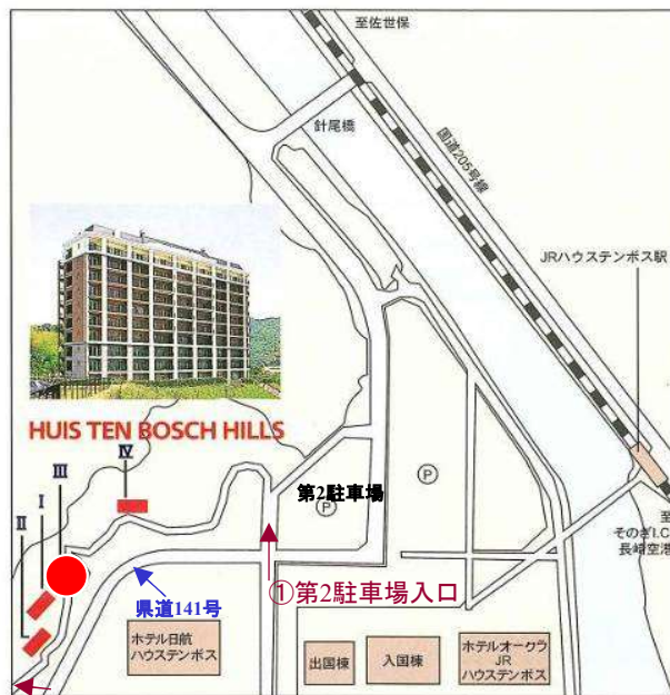
②至 グリーンメイク事務所入口方面

県道141号線より、①第2駐車場入口、②グリーンメイク事務所入口どちらからでも車で登って行けます。